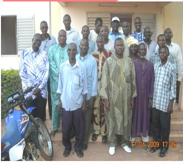
Personnel de la DRPSIAP de Mopti