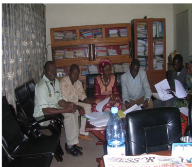
Personnel de la DRPSIAP du District de Bamako

Une bonne planification régionale et locale exige toujours l'utilisation des statistiques fiables et à jour.