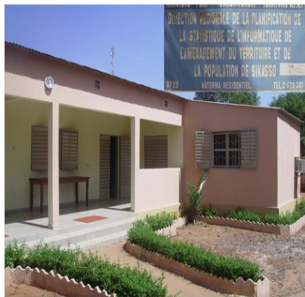
DRPSIAP de Sikasso

Une bonne planification régionale et locale exige toujours l'utilisation des statistiques fiables et à jour.