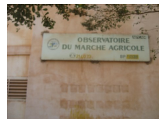
Observatoire du Marché Agricole

Il a également publié les rapports hebdomadaires (Communiqué, Poï Kan Poï, Situation et Synthèse). Ils portent sur les données et