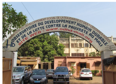
Observatoire du Développement Humain Durable (ODHD)

Une bonne planification régionale et locale exige toujours l'utilisation des statistiques fiables et à jour.