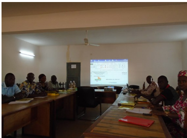
DRPSIAP de Ségou, réunion sur la mercuriale des prix

Elle a enfin participé du 13 au 17 Mars 2017 à l'atelier sur l'Archivage des données d'enquêtes et de recensements dont l'objet est de former d'une part les cadres du SSN à l'utilisation de l'outil de documentation et d'archivage NESSTAR PUBLISHER et d'autre part de les assister à l'archivage des données