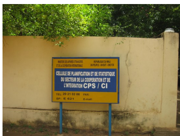
CPS Secteur Coopération et Intégration

Au titre des missions et appuis techniques, l'OMA en partenariat avec le CILSS, la FAO, FEWS-NET et le PAM a effectué une mission conjointe de 10 jours en vue d'évaluer la sécurité alimentaire et les marchés après les récoltes.