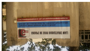
Groupe de Suivi Budgétaire

Il pourrait également être intéressé par des sessions de formations au cours desquelles les principaux sujets à aborder porteront sur la Gouvernance, les liens de la pauvreté entre les différents secteurs, les finances publiques, la balance des paiements et le suivi du budget.