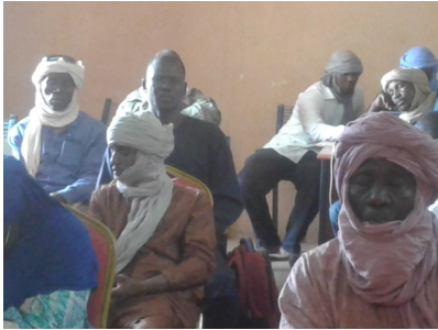
Cérémonie de lancement de la 20ème édition 2019 de la quinzaine de l'environnement à Gao

Une bonne planification du développement passe par l'utilisation des données de qualité et régulièrement mises à jour.