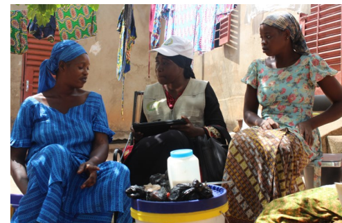
Agente cartographe en entretien dans une famille à Lassa en Commune III du District de Bamako