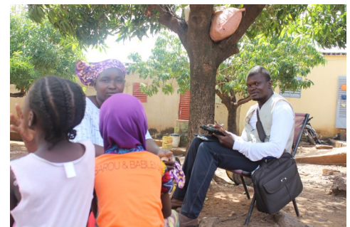
Agent cartographe en entretien dans une famille à Lassa en Commune III du District de Bamako