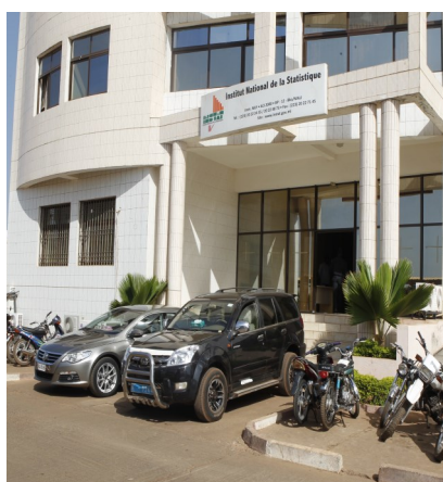
Devanture de l'INSTAT

La Gestion axée sur les Résultats (GAR) est l'instrument sur lequel s'appuie l'Institut National de la Statistique et ses démembrés en vue d'atteindre les objectifs du Système Statistique National du Mali.