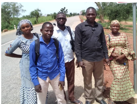
Agents DRPSIAP de Mopti

Une bonne planification régionale et locale exige toujours l'utilisation des statistiques fiables et à jour.