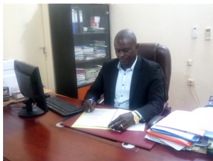
Directeur Régional de la DRPSIAP de Sikasso

Une bonne planification du développement passe par l'utilisation des données de qualité et régulièrement mises à jour.