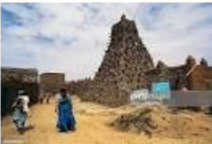
DRPSIAP de Tombouctou

Une bonne planification du développement passe par l'utilisation des données de qualité et régulièrement mises à jour.