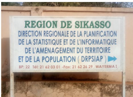
DRPSIAP de Sikasso

Une bonne planification du développement passe par l'utilisation des données de qualité et régulièrement mises à jour.