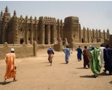
Great Mosque of Djenné --- Khan Academy

Le développement durable nécessite des statistiques sectorielles et locales appropriées.