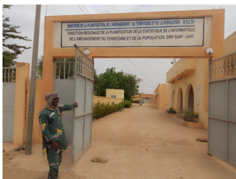
Direction Régionale de la Planification de la Statistique de l'Informatique de l'Aménagement du territoire et de la Population (DRPSIAP) de Gao

Une bonne planification du développement passe par l'utilisation des données de qualité et régulièrement mises à jour.