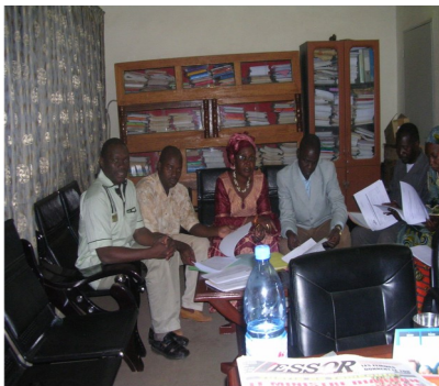
Personnel DRPSIAP District de Bamako

Une bonne planification régionale et locale exige toujours l'utilisation des statistiques fiables et à jour.