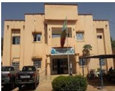
DRPSIAP de Bamako

Une bonne planification régionale et locale exige toujours l'utilisation des statistiques fiables et à jour.