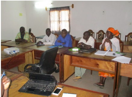
DRPSIAP Ségou - MERC18

Une bonne planification du développement passe par l'utilisation des données de qualité et régulièrement mises à jour.