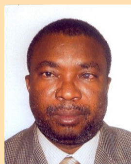
Directeur Général de l'Institut National de la Statistique.

contribuer à l'amélioration des résultats des politiques publiques. Pour ce premier numéro, la rubrique traite du thème « Le Système Statistique National, un outil au service de la bonne gouvernance » pour présenter d'une part l'environnement dans lequel les statistiques sont pro-