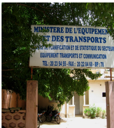
CPS Secteur Equipement Transport et Communication