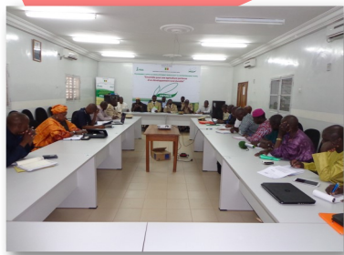
Réunion de la Commission Technique Mixte de mise en œuvre des activités de coopération frontalière Sénégal/Mali Tambacounda (Sénégal), les 11 et 12 Mars 2015

Une bonne planification régionale et locale exige toujours l'utilisation des statistiques fiables et à jour.