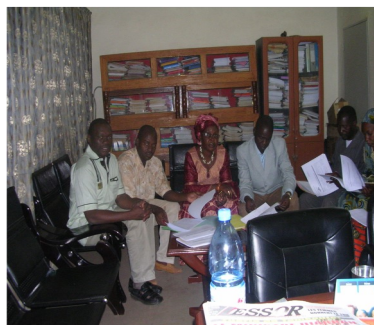
Personnel DRPSIAP District de Bamako

Une bonne planification régionale et locale exige toujours l'utilisation des statistiques fiables et à jour.