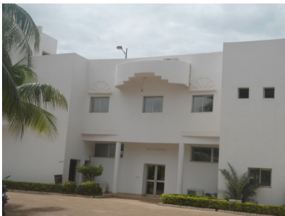
Haut Conseil des Collectivités Territoriales