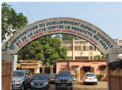
Observatoire Développement Humain Durable