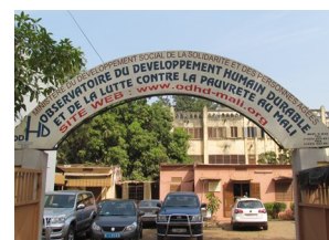
Observatoire du Développement Humain Durable (ODHD)

Il a également participé aux travaux de la réunion préparatoire de l'atelier de révision de la liste des indicateurs Malikunafoni visant à assurer la prise en compte du CREED, des ODD, de l'UNDAF et de nouveaux besoins sectoriels dans la liste d'indicateurs de Malikunafoni. Il a enfin participé aux travaux du Système d'Information Sociale (SISo) avec pour objet la prise en compte des indicateurs ODD et CREED dans les fiches de collecte du Système d'Information Sociale. Tenu à Bamako sur financement du MSAH, les travaux ont regroupé les services du Développement Social. On rappelle que ces activités s'inscrivent dans le suivi et la mise en œuvre du (SISo) du Ministère de la Solidarité et de l'Action Humanitaire (MSAH).