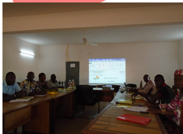
DRPSIAP de Ségou, réunion sur la mercuriale des prix

Une bonne planification régionale et locale exige toujours l'utilisation des statistiques fiables et à jour.