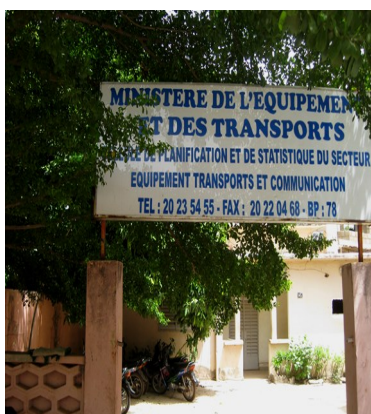
CPS Secteur Equipement Transport et Communication

Une bonne planification régionale et locale exige toujours l'utilisation des statistiques fiables et à jour.