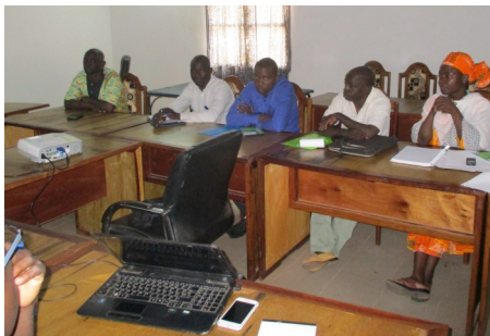
DRPSIAP Ségou - MERC18

La Gestion axée sur les Résultats (GAR) permet aussi d'améliorer les performances individuelles des agents et les capacités d'interventions des structures.