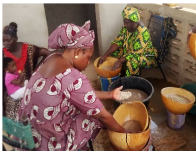
Image des bénéficiaires du PSEL Delta à Mopti

Une bonne planification du développement passe par l'utilisation des données de qualité et régulièrement mises à jour.