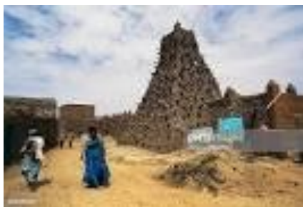
Photo prise à Tombouctou

Une bonne planification régionale et locale exige toujours l'utilisation des statistiques fiables et à jour.