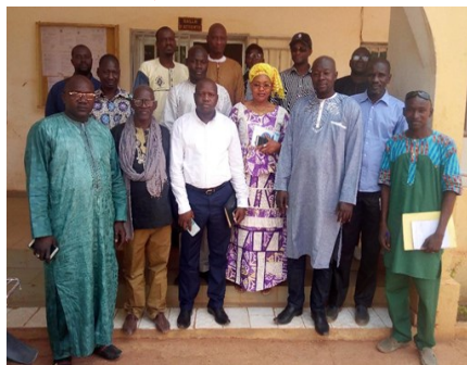
Visite de terrain de la commission PURD à Mopti

Une bonne planification du développement passe par l'utilisation des données de qualité et régulièrement mises à jour.