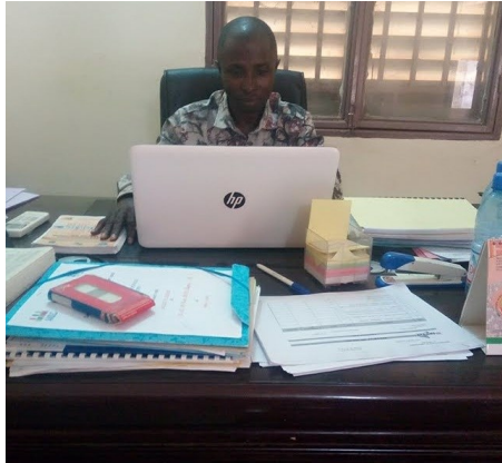
Chef Division Statistique DRPSIAP de Kayes

La Gestion axée sur les Résultats (GAR) permet aussi d'améliorer les performances individuelles des agents et les capacités d'interventions des structures.