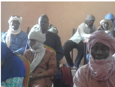
Cérémonie de lancement de la 20 ème édition 2019 de la quinzaine de l'environnement à Gao

• A Tombouctou à la cérémonie de remise des Check-points réalisés par la MINUSMA au profit des FAMA tenue le 29 avril 2019. L'objet de cette cérémonie est de remettre les Check-points réalisés par la MINUSMA aux FAMA, poser la 1 ère pierre des travaux de bitumage de la route Aéroport Gouvernorat. Financée par la MINUSMA, la cérémonie a regroupé l'Administration, les services techniques, FAMA et partenaires, les collectivités, les élus, la société civile, presse audio, écrite et visuelle.