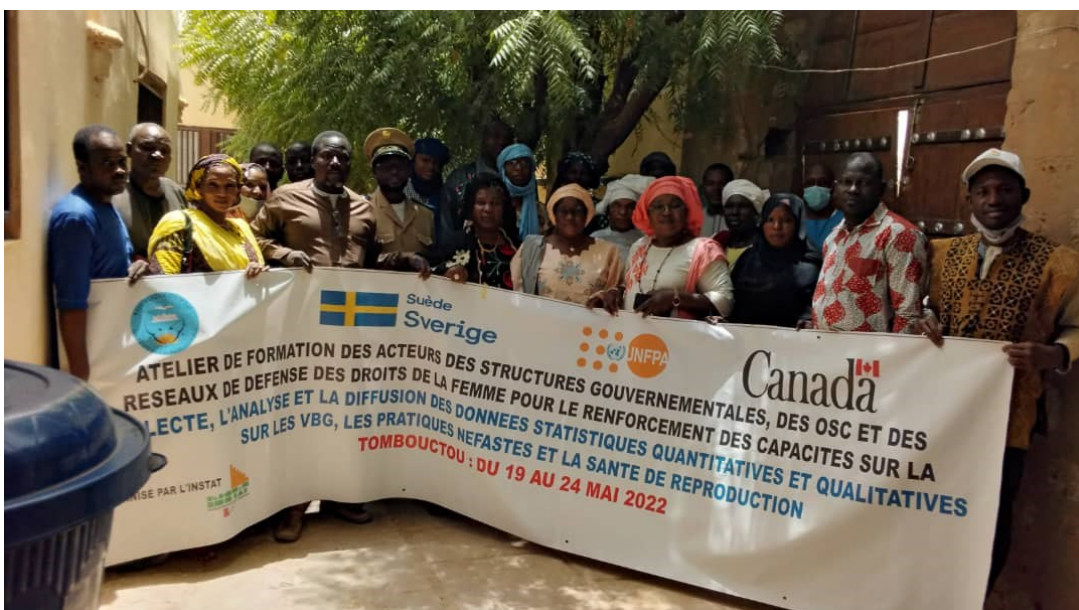
Atelier de restitution des résultats sur les Violences Basées sur le Genre (VBG), les pratiques néfastes et la santé de reproduction à Tombouctou

Avec un meilleur usage de bonnes statistiques, on peut s'attendre à de bons résultats en matière de développement durable.