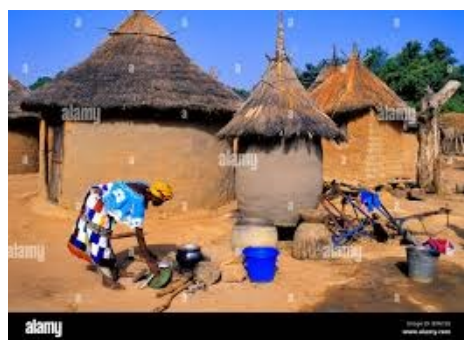
Image de la région de Koulikoro, Siby, village mandinka, femme dans sa cuisine

Le développement durable nécessite des statistiques sectorielles et locales appropriées