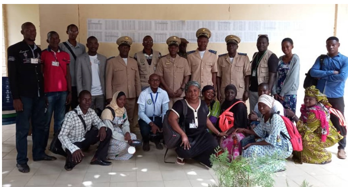
Lancement de la phase Dénombrement du RGPH5 à San

Une bonne planification régionale et locale exige toujours l'utilisation des statistiques fiables et à jour.