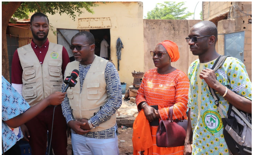
Le DG de l'INSTAT s'entretenant avec des médias, lors d'une supervision du dénombrement en Commune III du District de Bamako

Opération capitale pour la planification du développement du pays, l'engagement sincère et patriotique de toute la nation est nécessaire pour la réussite du Dénombrement.