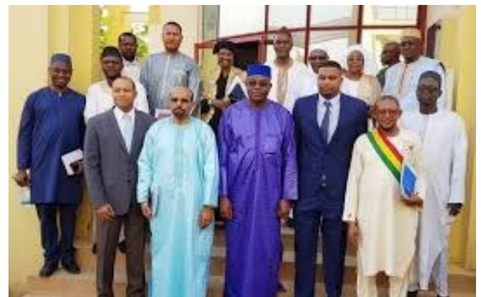
Afin de renforcer l'employabilité, le placement et le recrutement des jeunes, l'ANPE et la Plateforme « Djiguiya Espoir-Mali Solidarité » désormais main dans la main