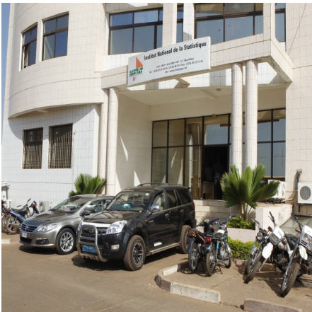
Devanture de l'INSTAT

Avec un meilleur usage de bonnes statistiques, on peut s'attendre à de bons résultats en matière de développement durable.