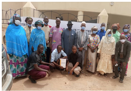
Atelier de validation et de restitution des résultats de l'enquête sur les Violences basées sur le genre, les pratiques néfastes et la santé de la Reproduction dans les zones de l'initiative Spotlight (Photo d'archives)

Les DRPSIAP sont des démembrés de l'Institut National de la Statistique au niveau régional. A ce titre, elles occupent une grande place dans la production de l'information statistique.