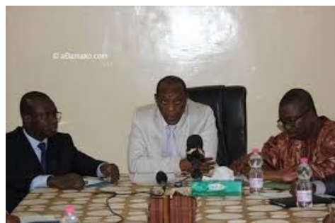
L'ONEF et l'INSTAT se donnent la main en vue de produire des données visibles sur l'emploi et la formation au Mali

Le Système Statistique National (SSN) du Mali est un système décentralisé regroupant : l'INSTAT, les DRPSIAP, les CPS, les Observatoires et des Agences spécialisées telles que l'ANPE.