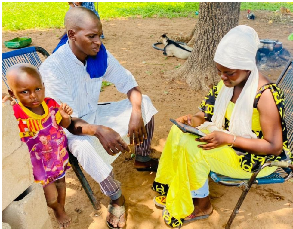
Une Agent recenseur en entretien dans un ménage à Kangaba, dans la région de Koulikoro

Ce Recensement nous concerne tous. Facilitons la tâche aux Agents Recenseurs en leur réservant un accueil chaleureux et en répondant clairement aux questions.