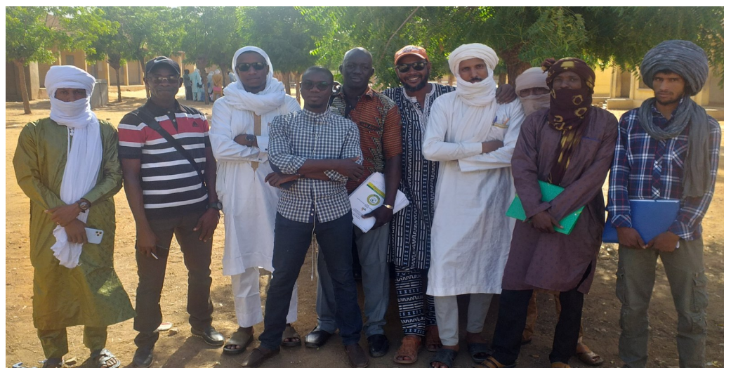
Les Superviseurs Régionaux et Locaux de la région de Kidal lors de la formation des contrôleurs de Kidal, Tessalit, Abeibara, Tin-Esako et Achibogo

Les bonnes statistiques sont nécessaires pour la réduction de la pauvreté, le suivi des Objectifs de Développement Durable, l'efficacité de l'aide et la promotion de la bonne gouvernance.