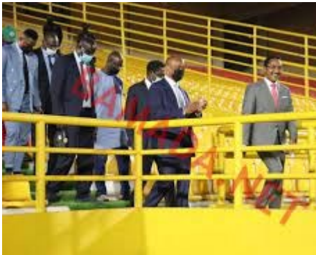
CPS/SCJ : Validation des fiches des métadonnées des indicateurs du secteur

Le Système Statistique National (SSN) du Mali est un système décentralisé regroupant : l'INSTAT, les DRPSIAP, les CPS, les Observatoires et des Agences spécialisées telles que l'ANPE.