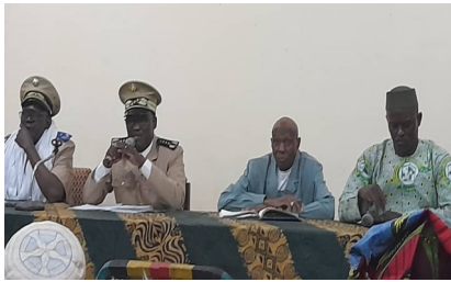
Message du Gouverneur de la région de Sikasso lors de la formation des Agents Recenseurs

La Direction a reçu la mutation d'un agent technicien de la statistique précédemment en service à la DRPSIAP de Ségou.