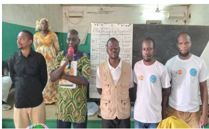
Mission de supervision pôle de Yanfolila

Le développement durable nécessite des statistiques sectorielles et locales appropriées.