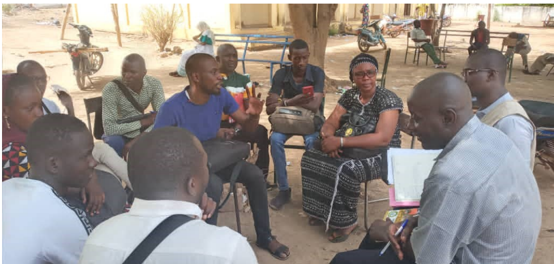
Séance de travail avec les CTIC de Bougouni

La qualité des données englobe des caractéristiques, comme la pertinence, l'exactitude, l'actualité, l'intelligibilité et la cohérence de l'information statistique.