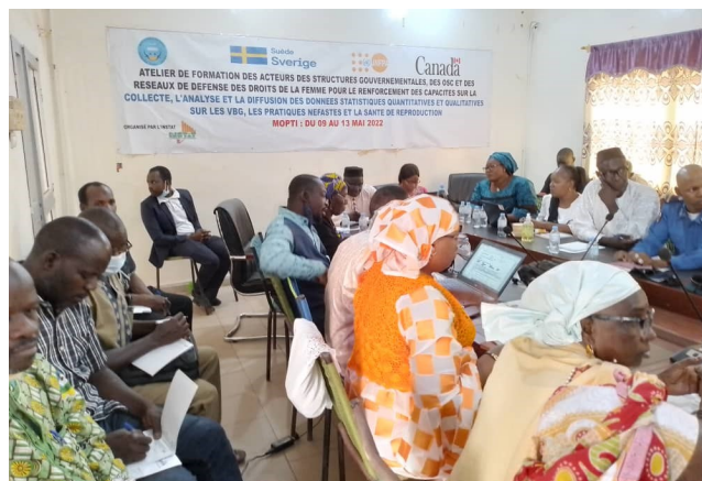
Atelier de restitution des résultats sur les Violences Basées sur le Genre (VBG) à Mopti

quième Recensement Général de la Population et de l'Habitat (RGPH5) dans les communes I, II, III, IV, V, et VI du District de Bamako.