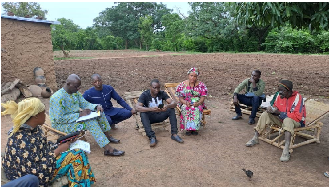
Mission de supervision du DRPSIAP dans la commune de N'Kourala (Hameau de Djelibougou)

Les bonnes statistiques sont nécessaires pour la réduction de la pauvreté, le suivi des Objectifs de Développement Durable, l'efficacité de l'aide et la promotion de la bonne gouvernance.