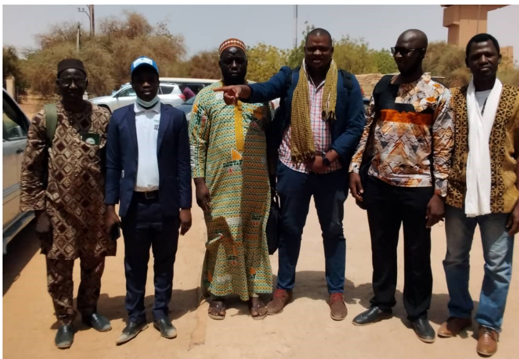
Photo des participants à l'atelier de restitution des résultats sur les Violences Basées sur le Genre (VBG) à Tombouctou

La Gestion axée sur les Résultats (GAR) est l'instrument sur lequel s'appuie l'Institut National de la Statistique et ses démembrés en vue d'atteindre les objectifs du Système Statistique National du Mali.