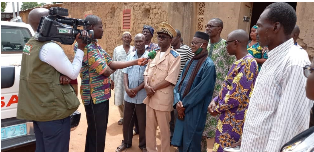
Lancement du dénombrement par le Directeur de Cabinet du Gouverneur de Koutiala

Le développement durable nécessite des statistiques sectorielles et locales appropriées.