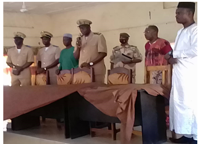
Visite du Gouverneur et sa délégation dans les salles de formation des Agents Recenseurs du RGPH5