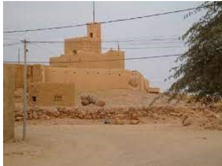
Image de Kidal, le 21 mai 2014