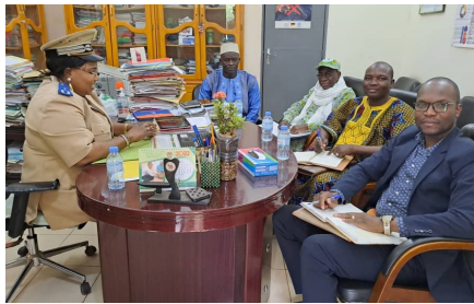
Rencontre des personnes ressources avec Madame le CAEF du Gouverneur de Sikasso .

◆ Le 06 Mai 2022, à Sikasso, à la Session CROCSAD d'approbation des dossiers de sous-projets soumis au financement de l'ANICT. Cette session a regroupé les Membres du CROCSAD.