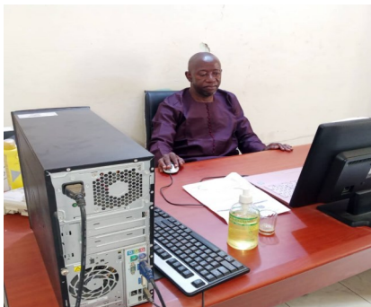
DRPSIAP-Kayes : Chef de Division Plan et Programme de la DRPSIAP

Les DRPSIAP sont des démembrés de l'Institut National de la Statistique au niveau régional. A ce titre, elles occupent une grande place dans la production de l'information statistique.