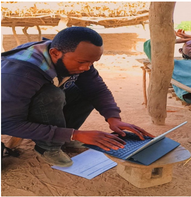
Un Contrôleur du RGPH5 faisant le dénombrement d'un ménage

Une bonne planification régionale et locale exige toujours l'utilisation des statistiques fiables et à jour.