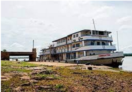
Image d'un bateau à Koulikoro

Le développement durable nécessite des statistiques sectorielles et locales appropriées