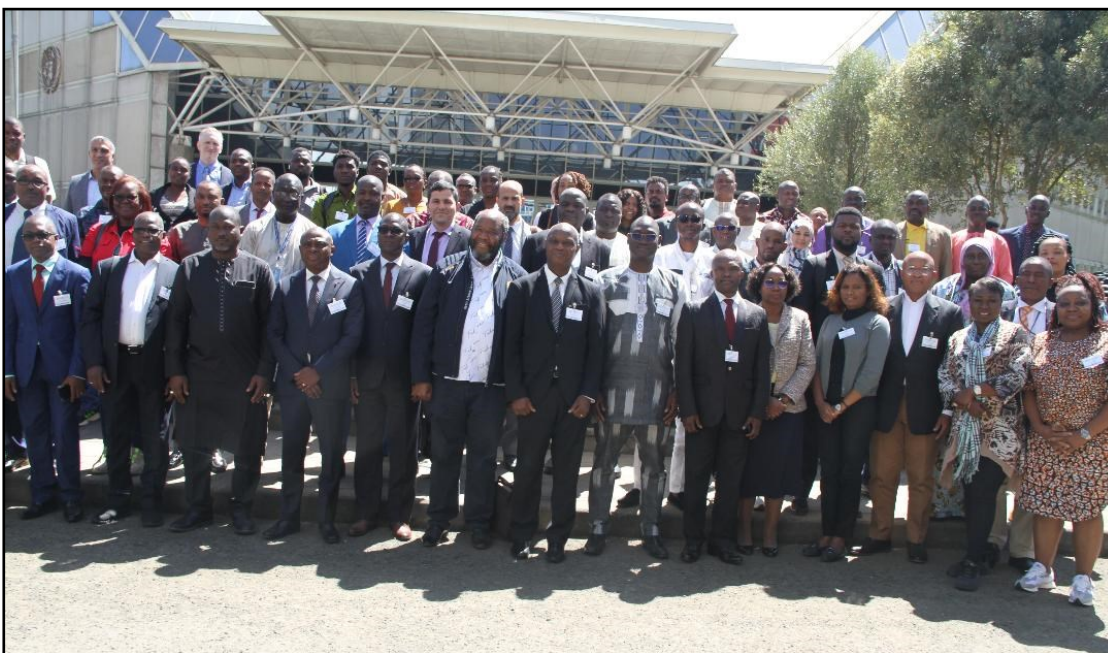
Photo de famille du séminaire régional sur l'Autoroute de l'Information en Afrique (AIA) d'Addis-Abeba (Éthiopie)

Les autorités statistiques doivent sensibiliser le public, et en particulier les fournisseurs de données statistiques sur l'importance de la statistique.