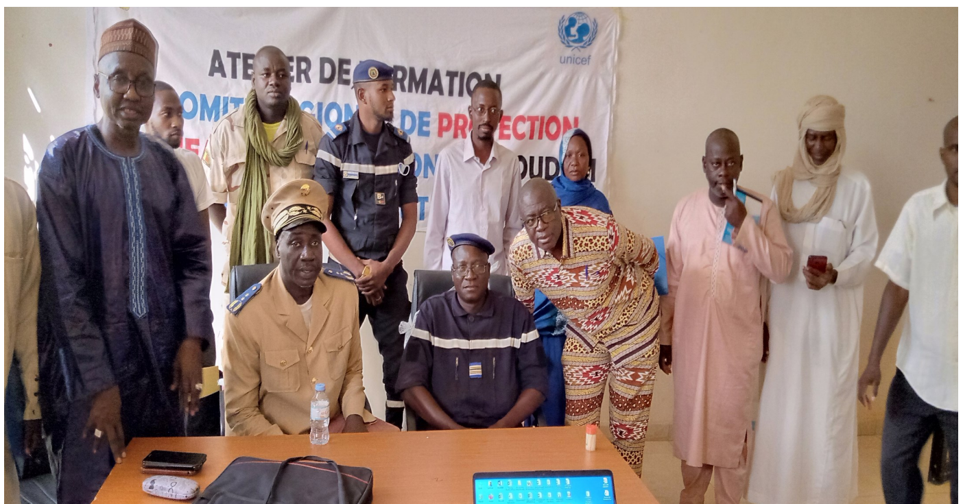
DRPSIAP de Taoudéni : Photo d'atelier

Promouvoir un développement inclusif et durable en faveur de la réduction de la pauvreté et des inégalités dans un Mali uni et apaisé, en se fondant sur les potentialités et les capacités de résilience en vue d'atteindre les ODD à l'horizon 2023.