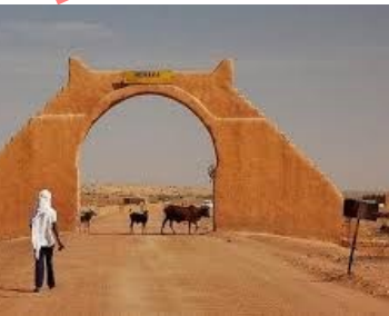
DRPSIAP de Taoudéni : Image de la région

• A la DRDSES, a un atelier du comité pour la gestion et traitement des Rumeurs sur la