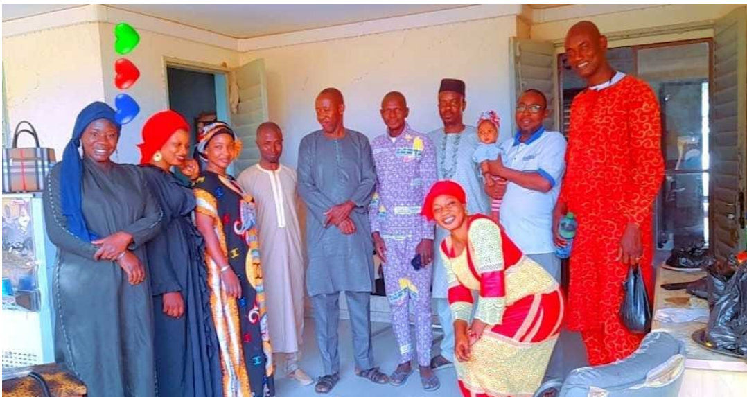
Une photo de famille du personnel de la DRPSIAP-Kayes

Les DRPSIAP sont des démembrements de l'Institut National de la Statistique au niveau régional. A ce titre, elles occupent une grande place dans la production de l'information statistique.