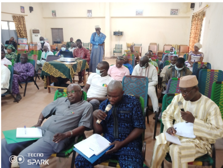
DRPSIAP-Sikasso : Salle des travaux de la validation de l'annuaire statistique de Sikasso 2021