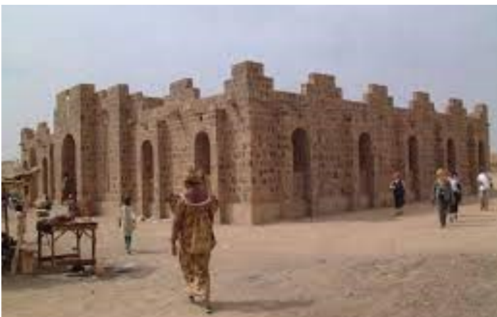
DRPSIAP-Kidal : Une image de la région

La DRPSIAP-Kayes a participé, en partenariat avec la Coopération Suédoise au 1er passage de l'Enquête Modulaire et Permanente auprès des ménages. Cette opération de trois (3) mois avait pour objet de renseigner principalement la matrice de suivi et d'évaluation du Cadre Stratégique pour la Croissance et la Réduction de la Pauvreté (CSCR).