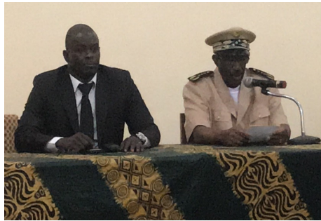
Réunion de la Commission Régionale du RGPH5 à Sikasso

Avec un meilleur usage de bonnes statistiques, on peut s'attendre à de bons résultats en matière de développement durable.