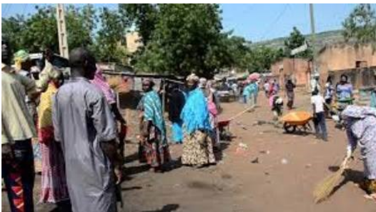
Accès à l'eau potable et Assainissement au Mali

Le Système Statistique National (SSN) du Mali est un système décentralisé regroupant : l'INSTAT, les DRPSIAP, les CPS, les Observatoires et une Agence spécialisée (l'ANPE).