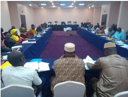
Une vue de la séance de restitution de l'Etude de satisfaction des besoins des utilisations de statistiques officielles (ESUSA).

L'étude a été réalisée grâce au financement de la Coopération suédoise.