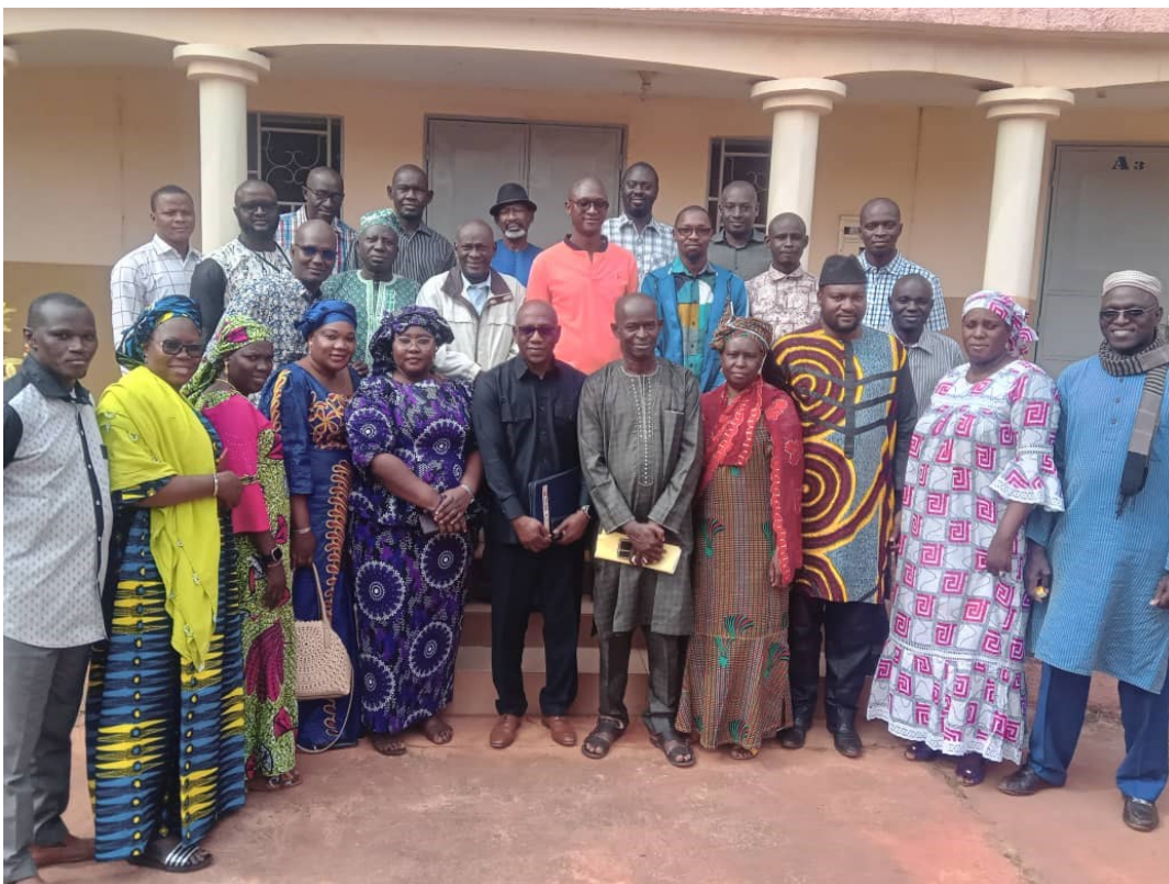
Photo de famille - Atelier Bibliothèque Numérique à Koulikoro du 18 au 24 Décembre 2022