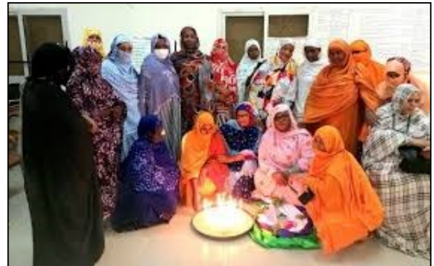
DRPSIAP de Taoudéni : Image de la région

• A la DRPSIAP de Tombouctou, à un atelier de formation dont l'objet était de former des contrôleurs et enquêteurs sur le questionnaire de base de l'enquête Modulaire et permanent auprès des ménages. Financé par l'INSTAT, l'atelier a regroupé les membres de l'Equipe de l'EMOP.