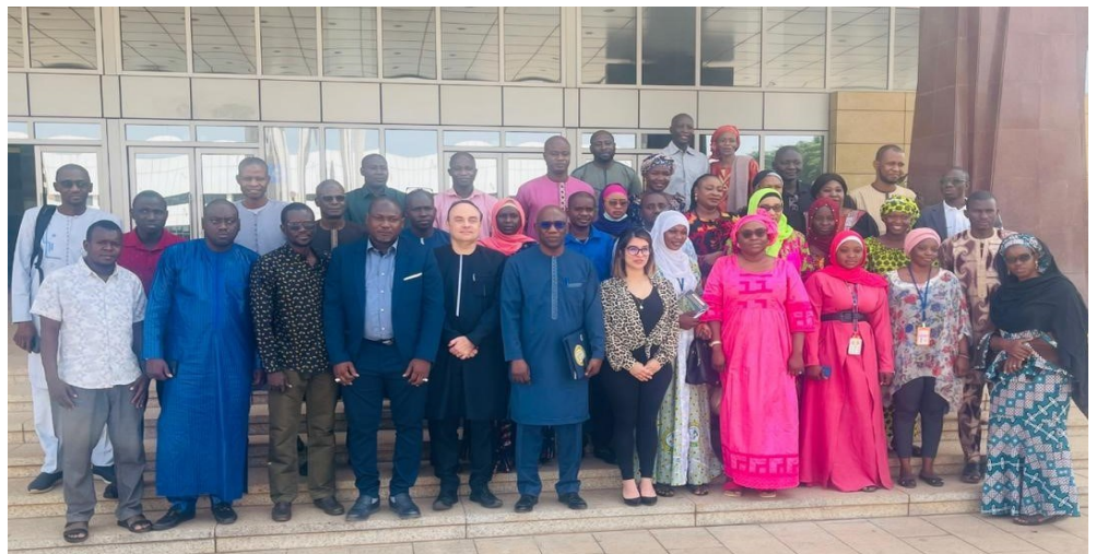
Photo de groupe de l'atelier de formation des journalistes à l'utilisation des données du RGPH5