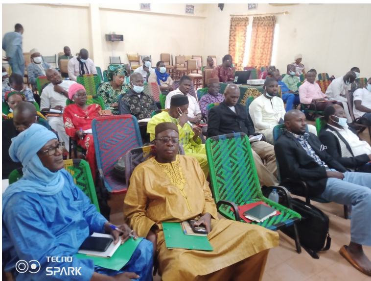
DRPSIAP-Sikasso : Participants, lors de la présentation de la méthodologie d'élaboration de l'annuaire statistique de Sikasso 2021

Avec un meilleur usage de bonnes statistiques, on peut s'attendre à de bons résultats en matière de développement durable.