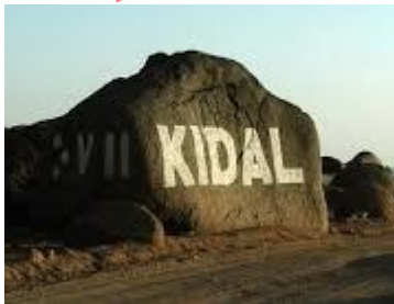
DRPSIAP-Kidal : Une image de la région

La DRPSIAP a participé aux manifestations de célébration de la journée du 8 Mars 2023 (journée des femmes).