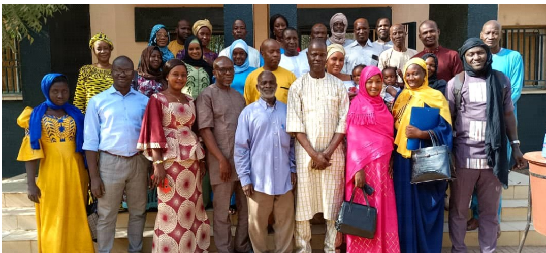
DRPSIAP de Gao : Image de l'atelier de renforcement de capacité des agents de collecte et de traitement de l'IHPC (Indice Harmonisé des Prix à la Consommation)

La production des statistiques de façon générale est fortement tributaire de l'apport des PTF.