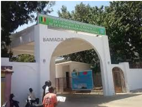
CPS/Secteur Coopération et Intégration

Le Système Statistique National (SSN) du Mali est un système décentralisé regroupant : l'INSTAT, les DRPSIAP, les CPS, les Observatoires et une Agence spécialisée (l'ANPE).