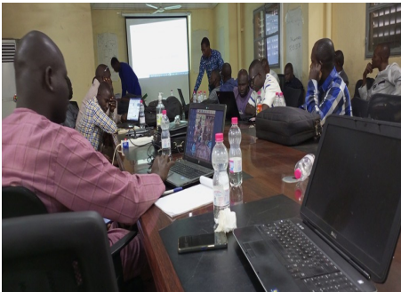
DRPSIAP-GAO-Image de l'atelier de formation des agents de collecte de L'EMOP 2023 sur le questionnaire de base édition 12

La production des statistiques de façon générale est fortement tributaire de l'apport des PTF.