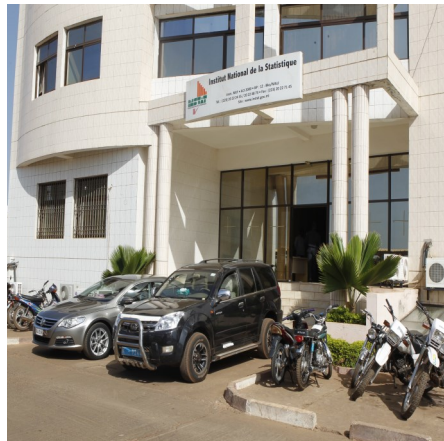
Devanture de l'INSTAT

Avec un meilleur usage de bonnes statistiques, on peut s'attendre à de bons résultats en matière de développement durable.